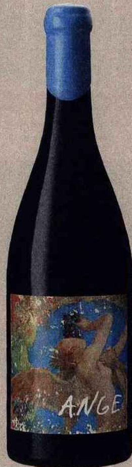
DOMAINE DE L'ÉCU, VIN DE FRANCE ANGE 2012. Le meilleur rouge du Pays nantais.